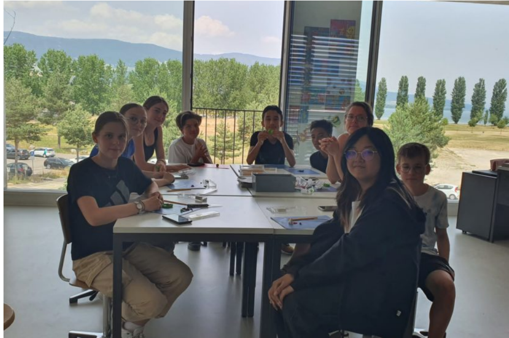
le groupe d'élèves du modelage

C'est un atelier de création de poterie et de sculpture. On y travaille la terre mais aussi d'autres formes comme la pâte fimo qui se cuit au four et avec laquelle on peut faire des bijoux ou des figurines. Dans cet atelier, on travaille aussi le plâtre.