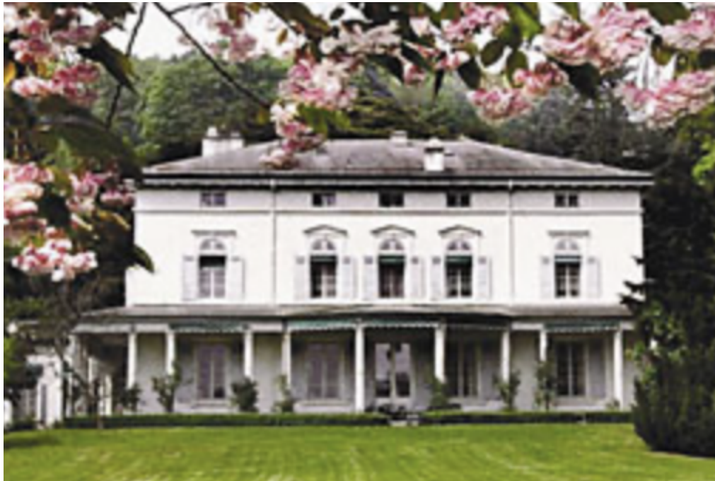
maison des Chaplin (internet)

Le but de l'atelier est de réaliser une courte vidéo. Pour y parvenir, les élèves ont appris à faire du montage et des transitions. Ils utilisent l'écran vert pour y incruster le décor qu'ils ont choisi pour leur vidéo. Les élèves filment et ensuite font le montage, ils ont aussi beaucoup travaillé la technique de la transition. Ils ajoutent aussi de la musique. Leurs vidéos seront visibles durant la visite de l'Exposition de vendredi.