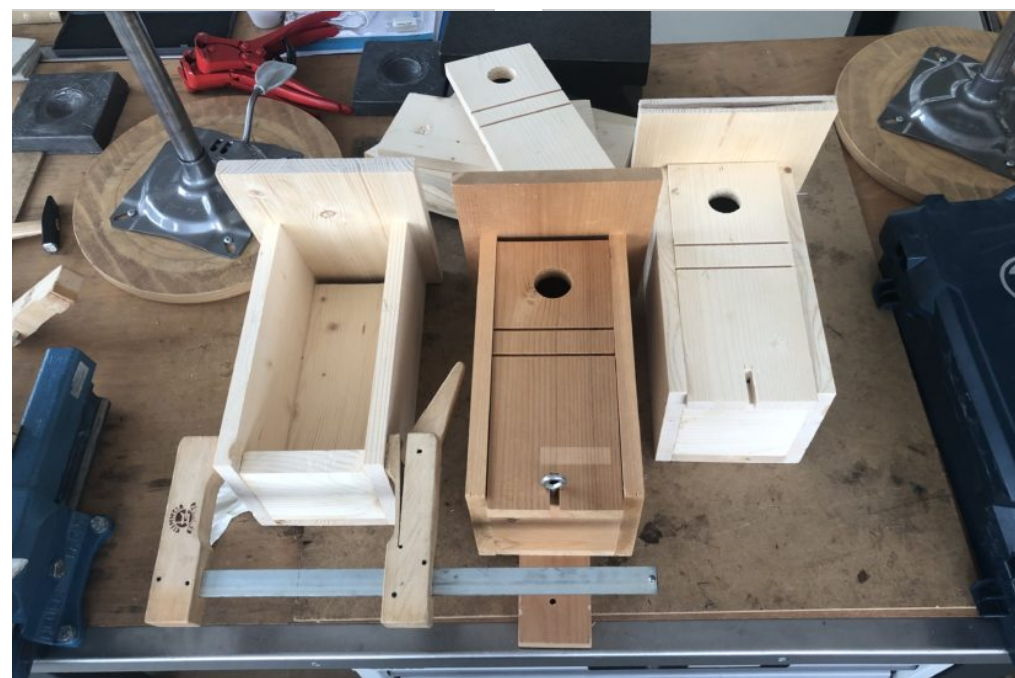
trois nichoir 22/06/23 Nolan

Dans cet atelier, Danick aime voir comment les oiseaux nichent et leur mode de vie. La sortie de mardi les a conduits à Sauges, au Centre Birdlife. Il a appris plein de choses et il a bien aimé voir les oiseaux nicher près de lui. Malheureusement il n'a pas photographié d'oiseaux. Dans l'atelier de l'école, ils ont créé des nichoirs qui seront récupérés par les élèves et ils pourront les mettre dans leur jardin ou balcon.