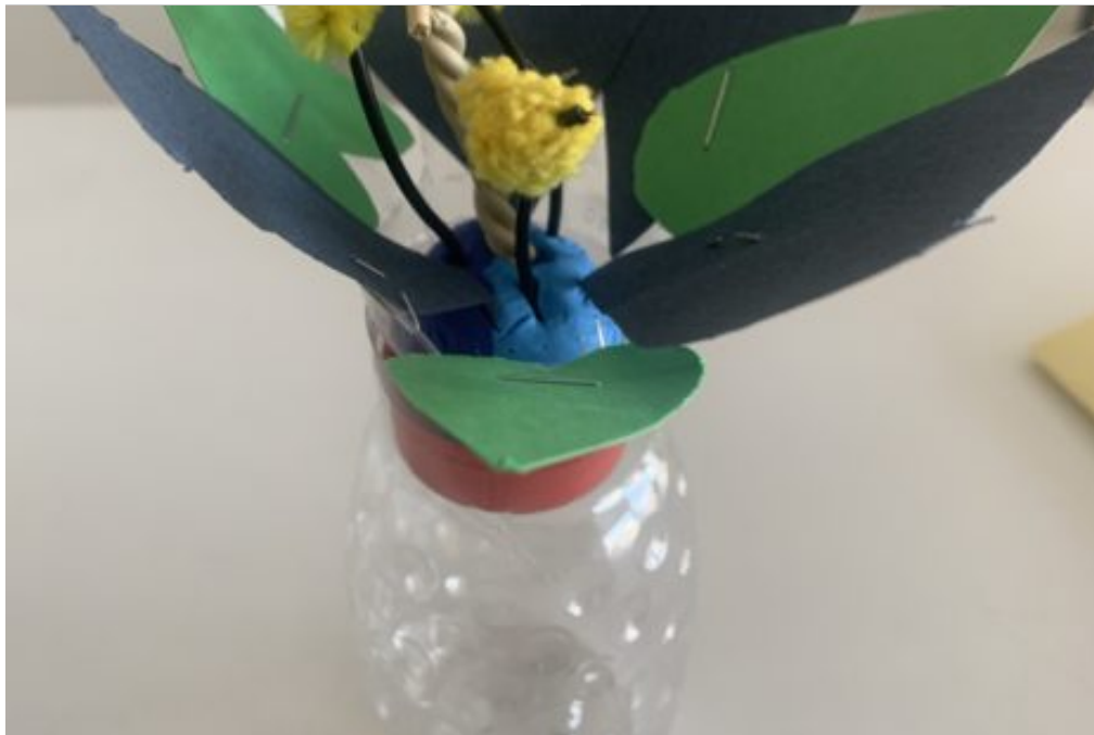
une des fleurs fabriquées

Damian rejoint l'avis de Gonçalo pour l'atelier mais a bien apprécié les balades et les dégustations.