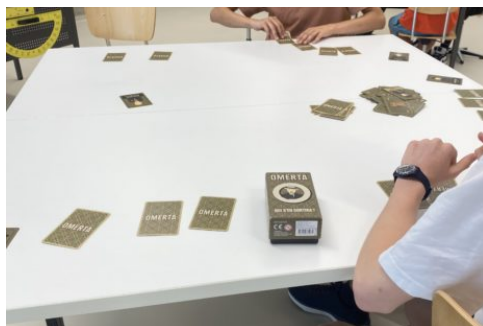
des élèves en train de jouer

Un jeu de draft, sous le nom de jeu de sélection, est un type de jeu où les joueurs participent à un choix d'éléments. Le terme « draft » vient de l'anglais et signifie « sélection ». Dans un jeu de draft, les participants doivent choisir un certain nombre d'options parmi lesquelles ils doivent faire un choix. Ces options peuvent être des cartes, des personnages, ou tout autre élément du jeu. Chaque joueur choisit à tour de rôle un élément jusqu'à ce que toutes les sélections soient terminées.