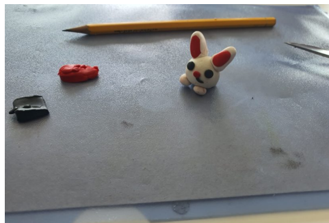
figurines en pâte fimo